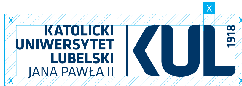
logo – wersja podstawowa

Pole ochronne znaku to obszar, w którym nie może pojawiać się żadna forma graficzna. Wielkość pola ochronnego uzależniona jest od wymiarów znaku. Wynosi ona X.